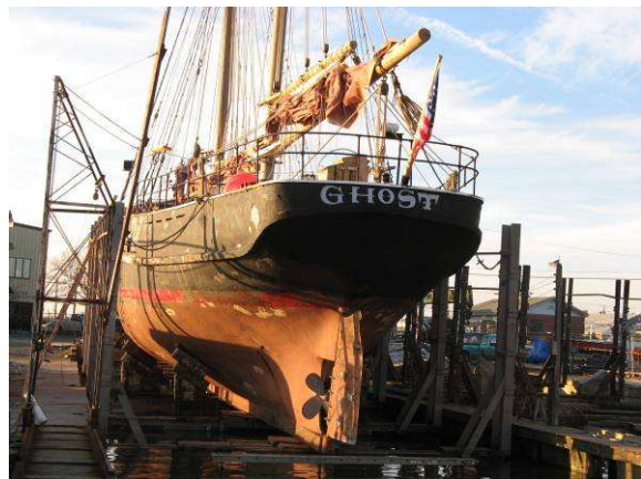
In Cape May auf dem Slip

Gespannt stachen wir in See: wie würde sich unser „Stein“ auf dem offenen Meer bewähren? Bereits auf unserer ersten Etappe von Cape May, NJ, nach Norfolk, Virginia, mussten wir feststellen, dass die „Ghost“ wirklich eher eine Kulisse als ein seetüchtiges Segelschiff war. In den 1970er Jahren als Nachbau eines historischen Frachtseglers gebaut, war die ex „Young America“ anscheinend für Repräsentationsfahrten in geschützten Gewässern deutlich besser geeignet als für den offenen Atlantik.