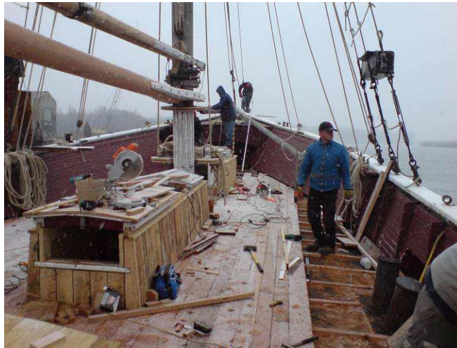
Bild 3 – Die „Kulisse“ nimmt Gestalt an, die Decksaufbauten sind verkleinert und mit Brettern verkleidet, im Schneetreiben wird das Holzdeck gelegt.

Mitte März war es dann so weit: am Heck wehte die Flagge von St. Vincent und den Grenadinen , am Bug leuchtete der neue Name, „Ghost“, wie sie nun als Filmschiff auch offiziell hieß und der verputzte Betonrumpf strahlte in einem makellosen neuen schwarzen Anstrich.