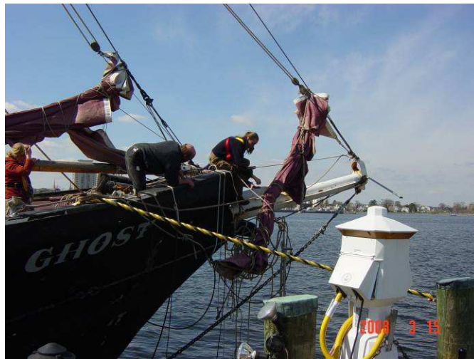
Bild 8 – das total verbogene und verhedderte Vorgeschirr

Nach einer schlaflosen Nacht (zumindest ich konnte nicht schlafen, solange das Wasser im Schiff genauso gluckerte wie außen an der Bordwand) erreichten wir lenzend den Hafen von Norfolk.