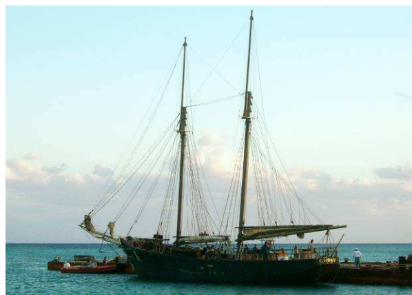
Bild 17, 18 – auf den Bahamas, mit gesetzten Stengen

Am nächsten Tag verholten wir die „Ghost“ dann ans andere Ende der Insel zu den Filmstudios, in deren Becken wir nur bei Hochwasser einlaufen konnten.