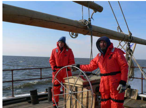
Überführungsfahrt nach Cape May in die Werft