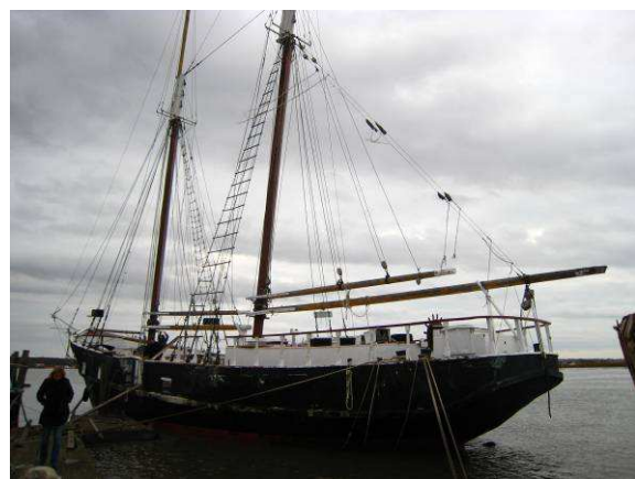
Die völlig verfallene und heruntergekommene „Young America“ in New Jersey

Als ich Ende Februar im winterlich kalten Millville, NJ, ankam, war der Rest der Besatzung schon dort. Alles Freunde und Kollegen, die ich von der „Undine“ und anderen Schiffen her kannte.